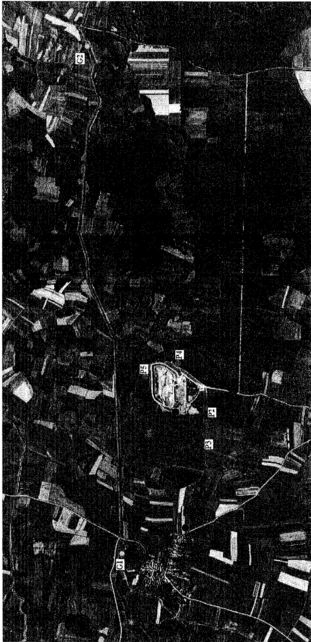
Prilog 2. Orto-foto karta s prikazom mjesta uzorkovanja voda i mjerenja buke